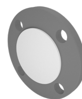
Finitura standard: vernice zincante epossidica grigia