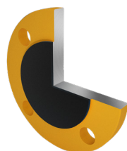
Flange cieche in versione Antistatica